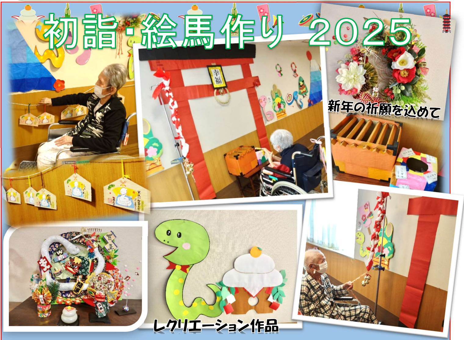
新年の祈願を込めて