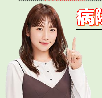
上手な医療のかかり方大使