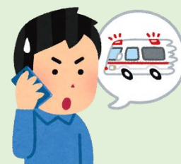
子ども医療電話相談